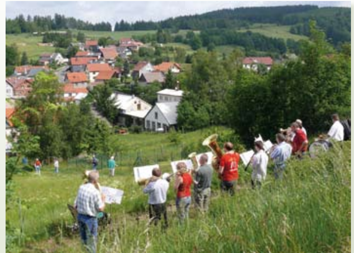
Blick auf OT Steinbach

Langenbach ist heute noch ein landwirtschaftlich geprägter Ort und wurde 1999 in die Dorferneuerung aufgenommen. Im August 2000