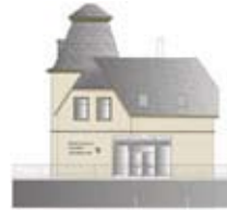
Villa ehemalige Gewürzmühle Schönbrunn