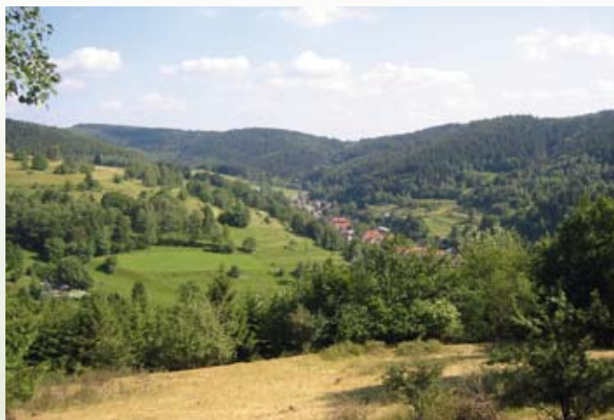
Blick ins Bibertal

Zu den Sehenswürdigkeiten der Ortschaft gehören die unter Denkmalschutz stehende Kirche im fränkischen Baustil, die am 12. April 1663 eingeweiht wurde und die Schanzanlage im Roßbachtal. Viele Vereine pflegen das Brauchtum und gestalten das dörfliche Leben. Hier sorgen der Kirmesverein und das Blasorchester für stimmungsvolle Stunden in gemütlicher Runde, auf sportlicher Ebene organisieren der Wander- und Fußballverein verschiedene Höhepunkte.