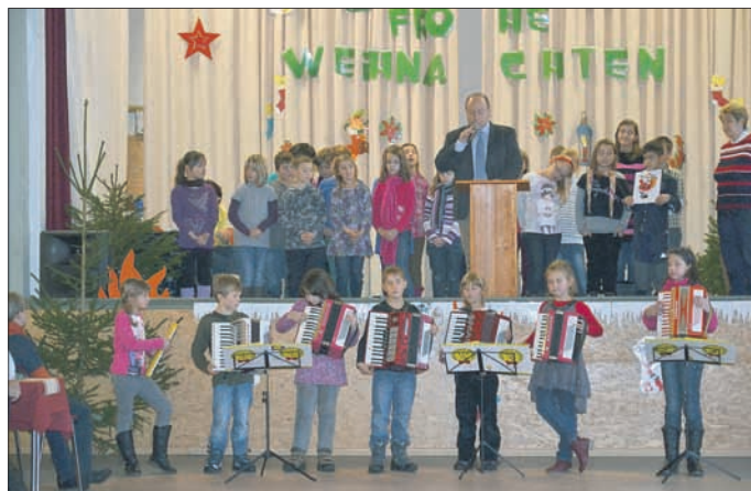
Unterhaltsames Weihnachtsprogramm der Schönbrunner Grundschüler zur Seniorenweihnacht

...„Das habt ihr wieder einmal schön gemacht und herzlichen Dank für eure Mühe“, war der Kommentar vieler Gäste, bevor sie sich auf den Heimweg machten.