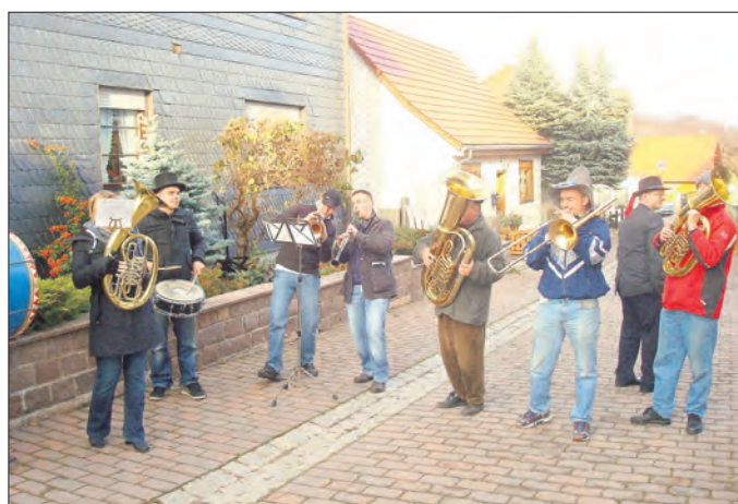
Das Blasorchester Gießübel e.V. beim Kirmesauftritt in Frankenhain im Jahr 2011

Für die Versorgung mit Speisen und Getränken sorgen die Bäckerei Hofmeister und die Fleischerei Brückner.