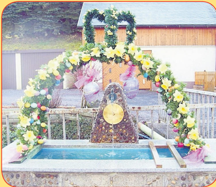
Osterbrunnen 2014 - Oberneubrunn

Für das bevorstehende Osterfest im Kreise ihrer Familien wünsche ich allen Bürgerinnen, Bürgern und Gästen unserer Gemeinde Schleusegrund, auch im Namen des Gemeinderates und der Gemeindeverwaltung frohe und erholsame Feiertage.